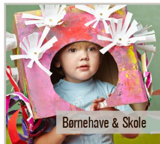
Børnehave & Skole