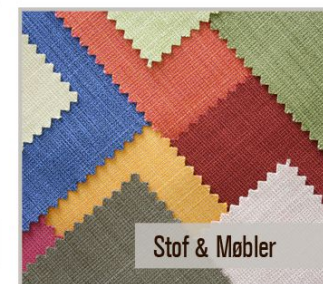
Stof & Møbler