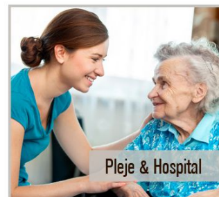
Pleje & Hospital