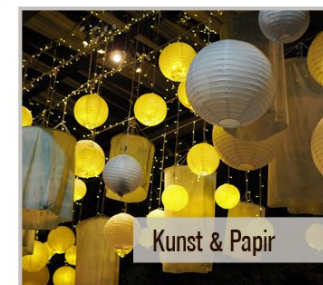
Kunst & Papir